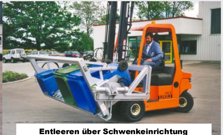
Entleeren über Schwenkeinrichtung