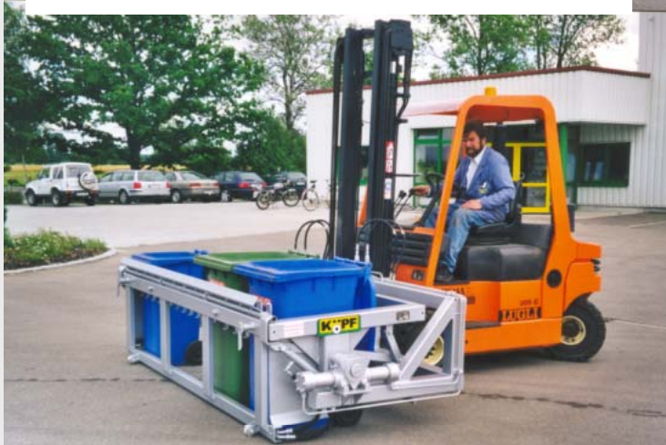
Behälter Spannen mit hydraulischer Spannvorrichtung