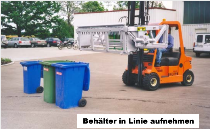
Behälter in Linie aufnehmen