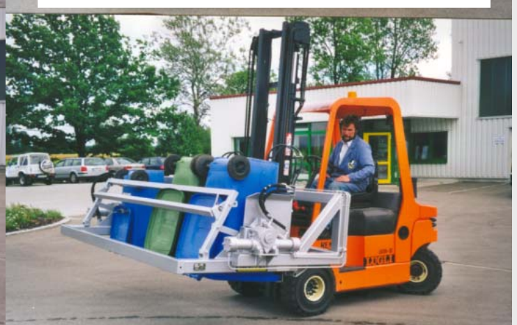
270° Drehwinkel für vollständige Entleerung