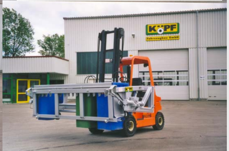
Abstellen entleerter Behälter