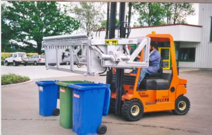
Aufnehmen vom Boden, Rampe bzw. Ladebordwand